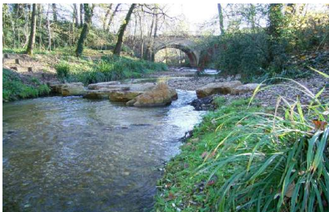
Le ruisseau de Caussels, l'atout charme du quartier