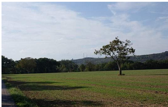
La plaine du Gô