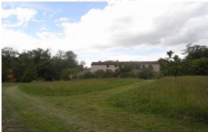
Les fermes de la Mouline