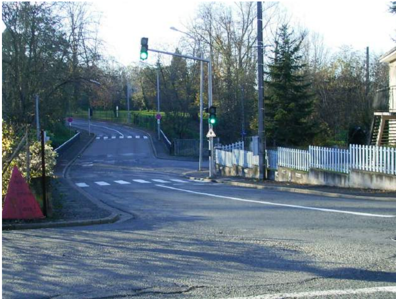
L'axe Loirat/Mouline – la colonne vertébrale du quartier