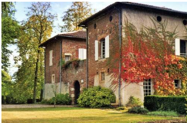
Le château du Gô